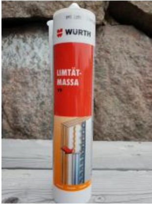
Wurth prod.nr: 08932251

Vägg & takskivor limmas med Wurth LIMTÄTMASSA vit.(c:a 1 tub / skiva)