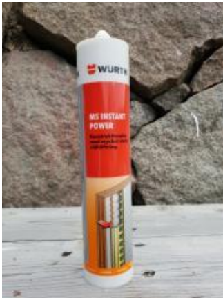
Wurth prod.nr: 0893225105

Lister limmas med Wurth MS INSTANT POWER vit. (c:a 1tub / 2 list)